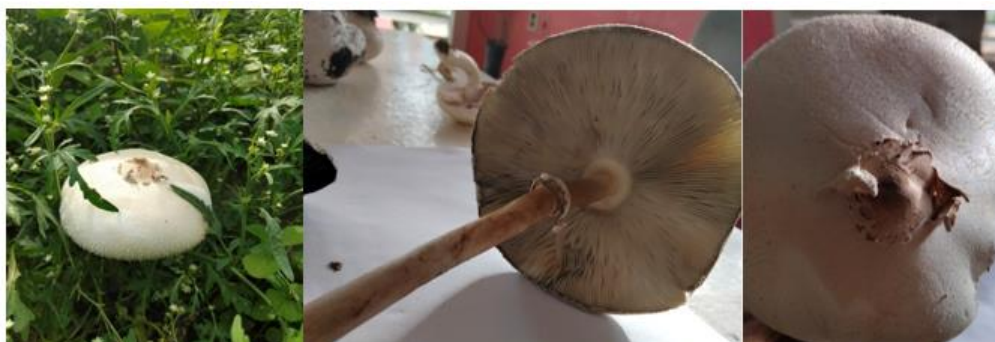
Figura 3. - Imágenes del cuerpo fructífero de Chlorophyllum molybdites (G. Mey.) Masee

La especie Chlorophyllum molybdites (G. Mey.) Masee presenta un píleo de 100-180 mm; de carne escasa, sobre todo en el borde, firme; inicialmente de esférico a ovalado, después hemisférico, y finalmente extendido, tendiendo a ondularse o deformarse, algo deprimido, a veces con ligero mamelón obtuso en el disco. Además, esta especie presenta un anillo y su modo de nutrición es Saprofito (Becerra y Mateo 2018).