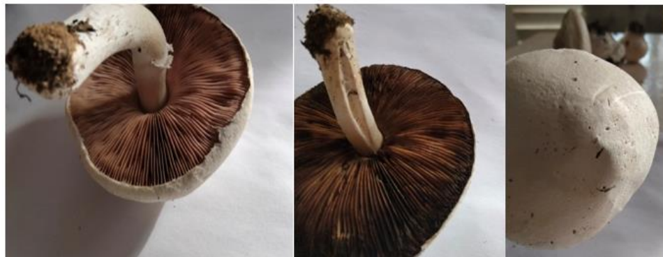
Figura 2. - Imágenes del cuerpo fructífero de Agaricus campestris (L.)

Álvarez et al 2021 encontró especies del género Agaricus asociadas a las familias Achatocarpaceae, Boraginaceae, Fabaceae, Nyctaginaceae y Polygonaceae presentaron durante las épocas de sequía y lluvia en México. Además, este género es simbiote obligado, de modo que la ausencia de las micorrizas afecta la supervivencia y el desarrollo de las plantas a las cuales se asocian (Salcido et al. , 2020).