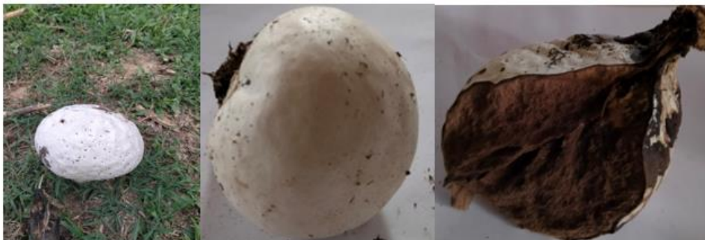
Figura 1. - Imágenes del cuerpo fructífero de Calvatia gigantea (Batsch) Lloyd

Este hongo presenta una fructificación de gran tamaño que puede llegar a medir hasta 65 cm, en forma de globo y de color blanco en su juventud, el cual presenta un modo de vida Saprófitico para esta especie (Barroetaveña et al. , 2020). Esta especie puede encontrarse de forma solitaria o en pequeños grupos sobre el suelo (Verma et al. , 2018).