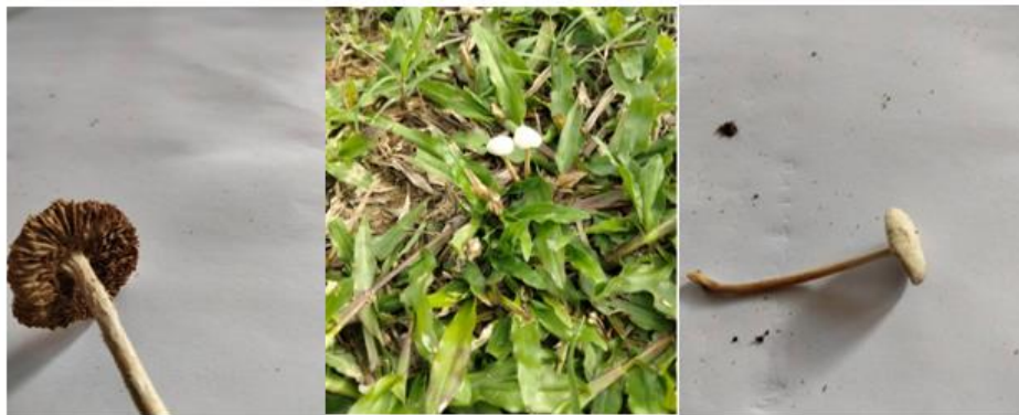
Figura 4. - Imágenes del cuerpo fructífero de Agrocybe Sp.

El género Agrocybe presenta un cuerpo fructífero que va de 10 y 40 mm de diámetro y con un modo de nutrición saprofita (Aza et al. , 2021). Este género brota con profusión en grandes grupos sobre cepas y troncos de álamos y otros árboles de ribera los cuales suele salir en buena parte del año, pero es conocido su carácter precoz en el brote, fructificando ya en agosto y sin lluvias (Jiménez, 2022).