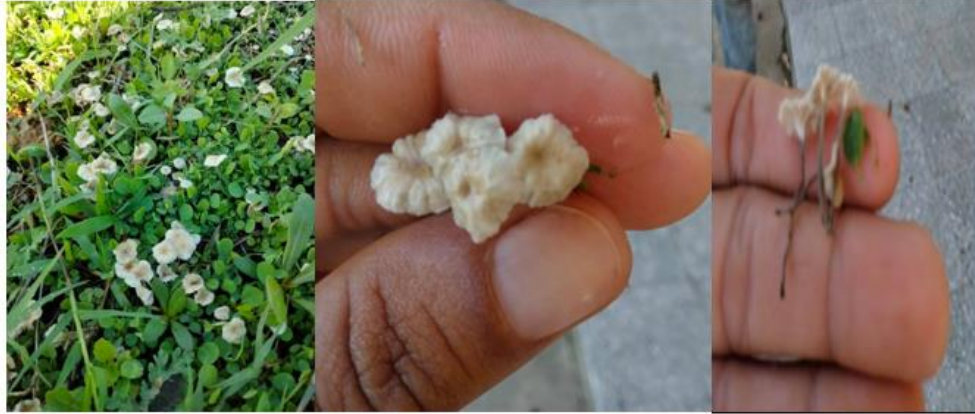
Figura 6. - Imágenes del cuerpo fructífero de Tetrapyrgos nigripes (Fr.) E. Horak

Jagdish et al. , 2019 encontró varias especies de hongos ectomicorrizicos asociados a Anacardium occidentale entre los cuales podemos citar a las especies Tetrapyrgos nigripes , Agaricus sp. Estas especies realizan una simbiosis micorrizica con la planta ayudándola en la nutrición por el aporte de fósforo y nitrógeno. Las ectomicorrizas se pueden emplear como indicadores de calidad para las plantas forestales en condiciones de viveros ya que estas ayudan en la nutrición de las mismas (Montoya, 2016).