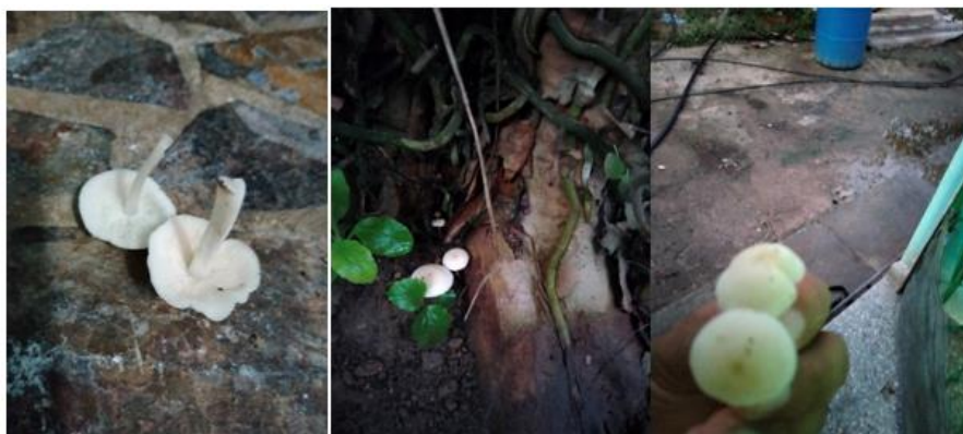
Figura 5. - Imágenes del cuerpo fructífero de Lactocollybia Sp

Las especies de ectomicorrizas pertenecientes al orden agaricales se relacionan con plantas de las angiospermas distribuidas en el bosque tropical caducifolio lo cual coincide con este espécimen el cual fue encontrado en asociación con árboles de Psidium guajava en zonas tropicales (Álvarez et al 2021).