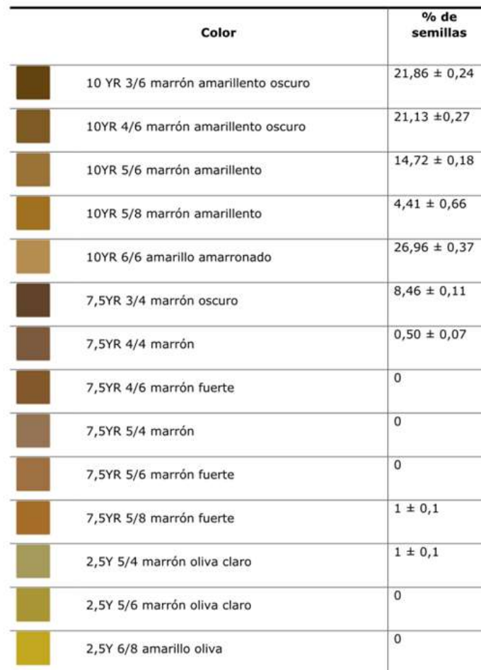
Tabla 2. - Caracterización colorimétrica de las semillas con la carta de colores Munsell para suelos para conocer su variabilidad

Respecto del análisis de color y uniformidad de la cubierta seminal, el 26,96 % de las semillas categorizó para el tono amarillo amarronado (10YR valor 6, intensidad o saturación 6); el 21,86 % para marrón amarillento oscuro (10YR valor 3, intensidad o saturación 6) variando ambos solo por el valor no en tono ni saturación; el 21,13 % para marrón amarillento oscuro (10YR valor 4, intensidad o saturación 6) y el 14,72 % para marrón amarillento (10YR valor 5, intensidad o saturación 6) (Tabla 2).