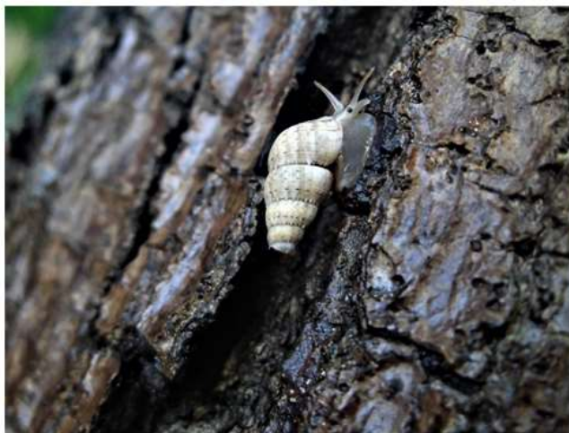
Figura 2. - Imagen ilustrativa de la morfología externa de P. neglectus durante la actividad diurna en el tronco de Swietenia mahagoni favorecida por las lluvias en la localidad

La altura sobre el suelo presentó un valor medio de 153,5 \pm 71,3 cm y un máximo de 394 cm. Durante los días lluviosos aumentó la frecuencia de moluscos de P. neglectus en el tronco. Se observó también un mayor número de individuos activos en este sustrato (Figura 2).