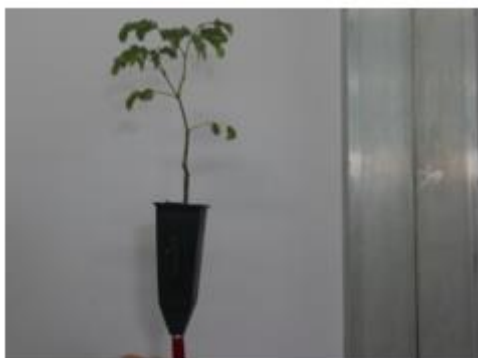
Figura 2. - Altura de la planta en el tratamiento S1

Salto et al. , (2013), plantean que los atributos morfológicos de naturaleza cuantitativa que habitualmente son empleados en estudios científicos o en control de calidad de plantas en contenedor son la altura y el diámetro a la altura del cuello. Quiroz et al. , (2014) coinciden con estos criterios y mencionan que los atributos morfológicos comúnmente medidos para determinar la calidad de planta se relacionan con su altura y su diámetro, de ahí su importancia en los análisis efectuados en el contexto de este experimento.