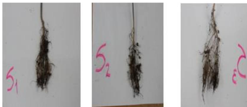
Figura 3. - Arquitectura radical de las plantas en cada uno de los sustratos

Puede afirmarse que las raíces de las plantas evaluadas en este experimento colonizaron completamente el cepellón y carecían de deformaciones, que pudieran afectar el desarrollo futuro en plantación (Figura 3).