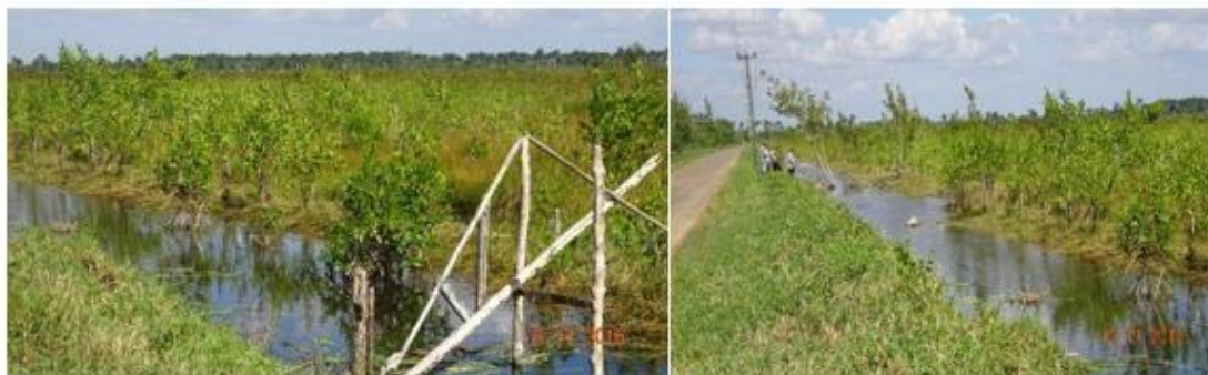
Fig.4. Proyecto de rehabilitación hídrica mediante canalización

Se elaboró el proyecto de rehabilitación hídrica que se puso en marcha y se construyó el canal para favorecer la rehabilitación hídrica de la zona, el cual llega al manglar, con un intercambio más refrescante y favorecido (Figura 4).