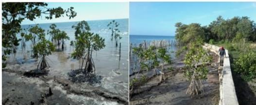
Fig. 3. Éxito de la reforestación de la especie Rydzophora mangle L. como resultado del proyecto empresarial.

En todas las parcelas, la diversidad de fauna se comportó escasa. Se espera que, próximamente, en la medida que la reforestación tenga éxito, como va indicando hasta el momento, comience a aumentar la fauna, tanto terrestre como marina. Está contemplado su seguimiento en el proyecto.