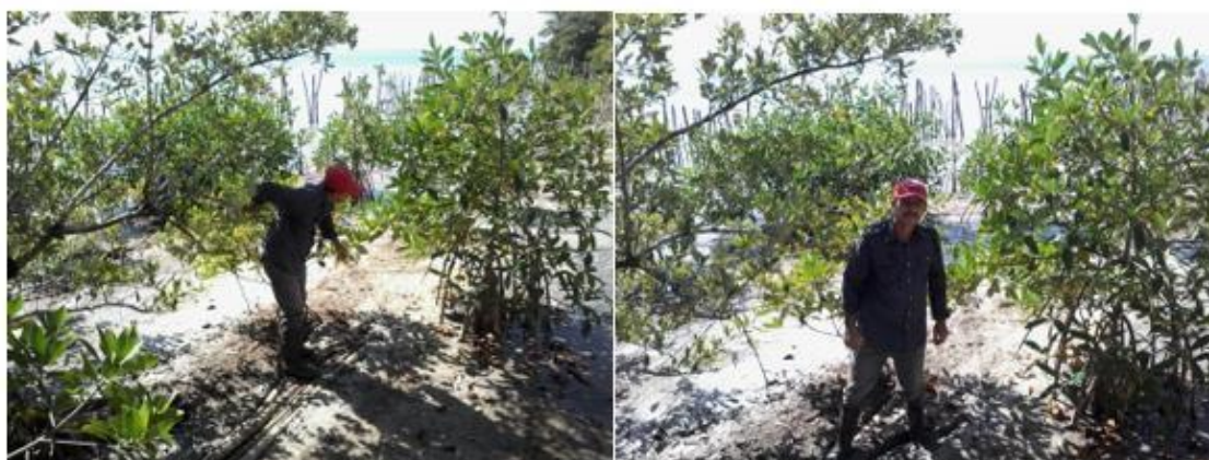
Fig.5. Establecimiento de Ryzophora mangle previa rehabilitación hídrica

Fue necesario realizar el proyecto de rehabilitación hídrica de la zona antes de planificar la reforestación; para ello, se contó con la participación de la comunidad, organismos involucrados y expertos en el tema, y quedó conformado el proyecto que incluye la realización de canalizaciones, zanjas y limpieza de esteros (Anexo). Obsérvese el éxito de la reforestación de Ryzophora mangle en lo fundamental (Figura 5).