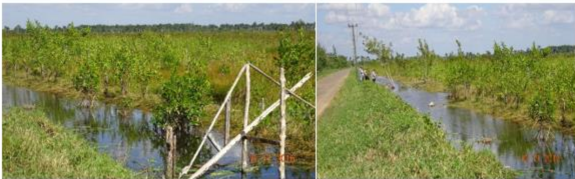
Fig.4. Proyecto de rehabilitación hídrica mediante canalización

Se elaboró el proyecto de rehabilitación hídrica que se puso en marcha y se construyó el canal para favorecer la rehabilitación hídrica de la zona, el cual llega al manglar, con un intercambio más refrescante y favorecido (Ver figura 4).