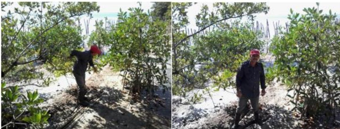
Fig.5. Establecimiento de Ryzophora mangle previa rehabilitación hídrica

comunidad, organismos involucrados y expertos en el tema, y quedó conformado el proyecto que incluye la realización de canalizaciones, zanjas y limpieza de esteros (ver anexo). Obsérvese el éxito de la reforestación de Ryzophora mangle en lo fundamental.