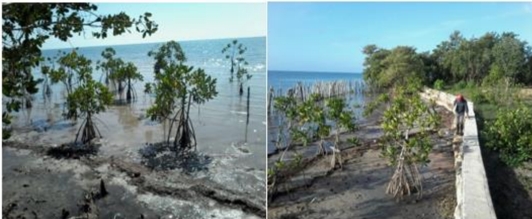
Fig. 3. Éxito de la reforestación de la especie Ryzophora mangle L. como resultado del proyecto empresarial.

En la siguiente figura, se muestran los avances de la reforestación de la especie Ryzophora mangle L., lo cual ha respondido a iniciativas de los lugareños en cuanto a la colocación de empalizadas en lugares donde el oleaje es más intenso. Ello ha favorecido al éxito de la reforestación de dicha especie, que en muchos sitios ha alcanzado el establecimiento.