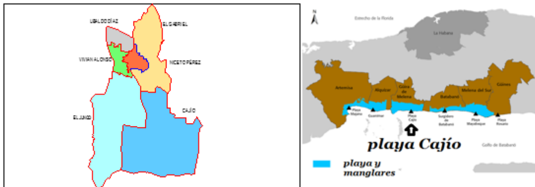
Fig.1. Ubicación del área objeto de estudio: manglares de playa Cajío, Güira de Melena. Artemisa.