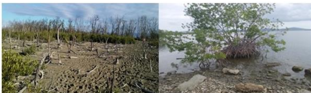
Fig. 3. Árboles muertos y pobre vegetación en la línea costera.

En la observación realizada al área de estudio, se encontraron árboles con troncos torcidos, deformaciones, secos y con bajo porte. La causa fundamental de estas afectaciones es la acción antrópica con el fin de cubrir sus necesidades, factor que determina la fisionomía de los rodales, por lo que árboles que no llegan a alcanzar alturas y diámetros adecuados han sido a través del tiempo aprovechados para leña y fabricación de carbón. Por otra parte, se observa deterioro de la vegetación de manglar debido a las tensiones a que está sometido este ecosistema. La vegetación de la línea de costa ha sido afectada por la tala y la erosión, se observan tramos costeros desprovistos de vegetación (Figura 3).