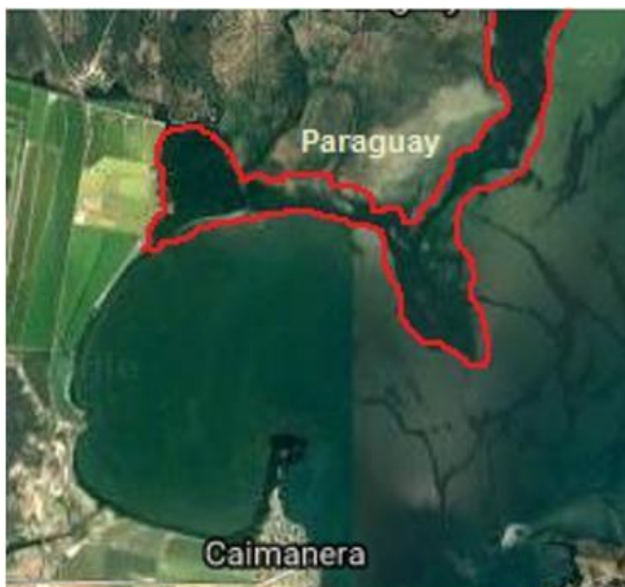
Fig.1. Localización del área de estudio. Fuente: Google Earth 2018.

El trabajo se desarrolló en el bosque de manglar que bordea la bahía de Guantánamo, específicamente, en el sector costero Paraguay (Figura 1) el cual posee una extensión territorial de 142 Km 2 y cuenta con una superficie boscosa protectora del litoral de 624 ha, la cual se tomó como referencia para el estudio realizado. Este sector limita al norte con el Consejo Popular Honduras, al este con el municipio de Manuel Tames, al sur con la bahía de Guantánamo y al oeste con el Consejo Popular San Justo.