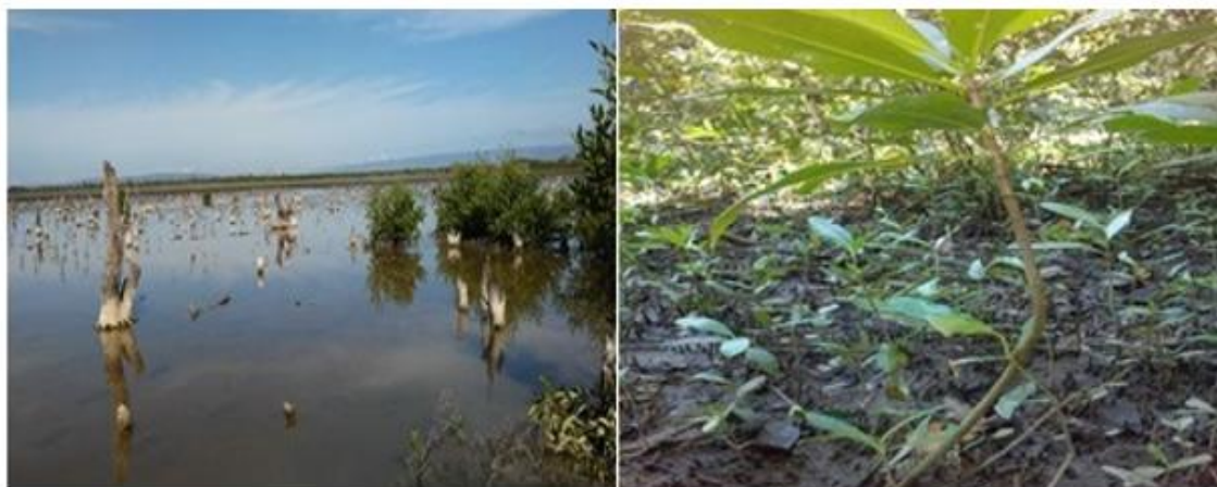
Fig. 4. Afectación por eventos naturales y regeneración natural.

Resultados similares reportó Rodríguez et al. , (2014), en un bosque de manglar del sector costero Cortés en Pinar del Río. Se afirma que el comportamiento de la regeneración natural es bueno, y se evidencia buena cantidad de plántulas incipientes.