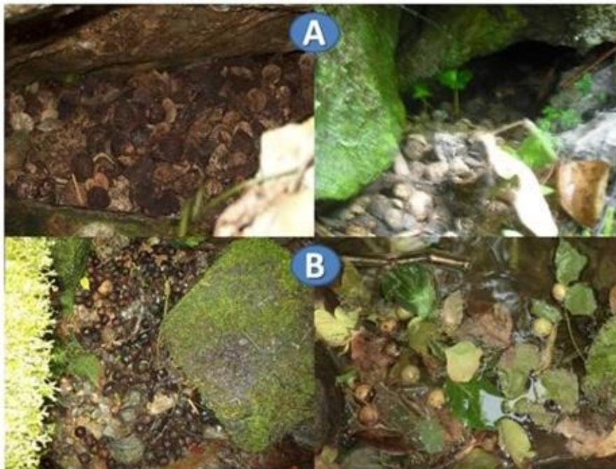
Fig. 3. Acumulación de semillas bajo rocas (A) y en el curso de agua (B) como indicador de los factores bióticos y abióticos que pueden influir en la dispersión de las semillas de Juglans jamaicensis en el Parque Nacional Turquino.

Teniendo en cuenta lo anterior y conociendo que la autocoría es un mecanismo de dispersión únicamente relacionado con el árbol progenitor, que deja caer las semillas maduras Noir et al. , (2002), es importante reconocer que las especies autocóricas probablemente dependen de un dispersor secundario, pues según Van der Pijl 1982), citado por Matsumoto (2009) Miranda et al. , (2005), muchas no disponen de mecanismos eficientes para la dispersión.