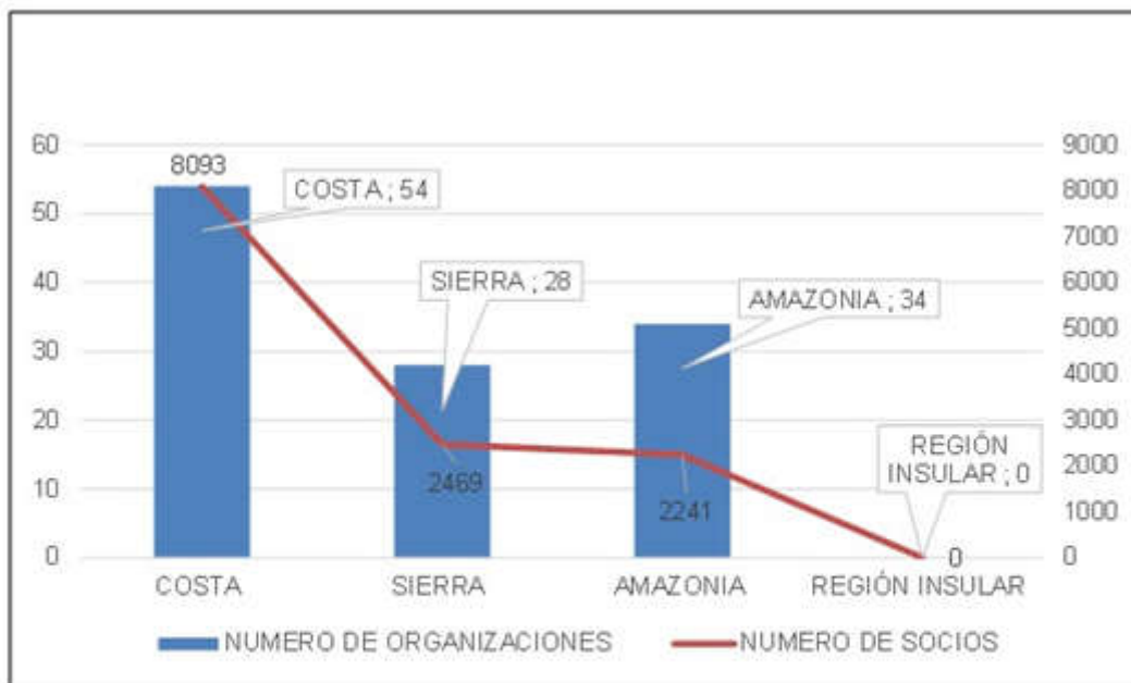
Fig. 3. Organizaciones de productores cafetaleros de Ecuador y el número de socios que la integran por región.